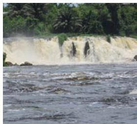
Chutes de la Lobé

A big mountain set amidst the middle of the well preserved hévéa plantations, another facet of the Ocean department (45 km from Kribi).